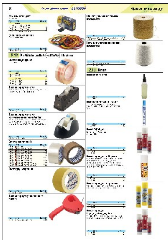
Вы можете «полистать» предыдущую редакцию каталога на нашем сайте по адресу www.delovoy.by/cat